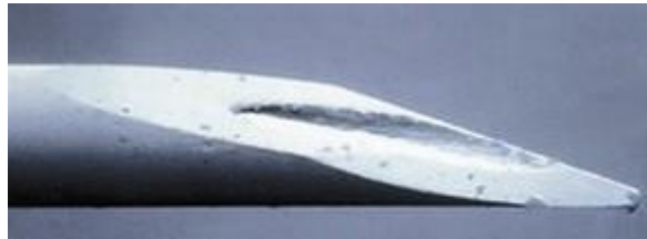
Aguja usada una vez