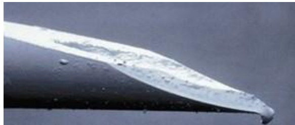
Aguja usada dos veces